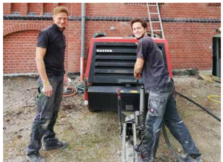
Unterstützung durch Nachsorge Amelith