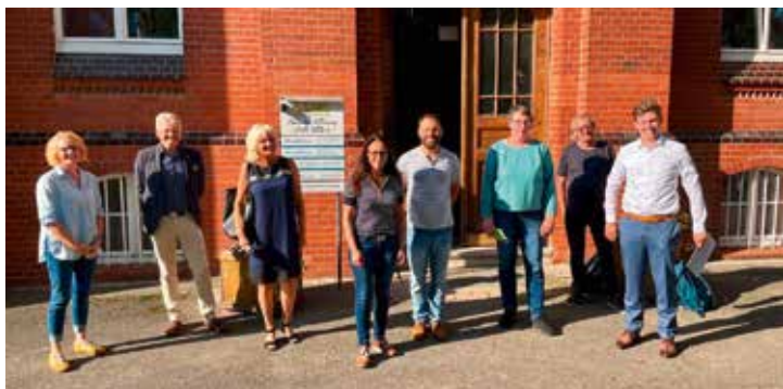
SPD zu Besuch im Haus der Hoffnung

Auch an den beiden Therapiestandorten in Schorborn und Amelith gibt es insgesamt 22 Plätze im Rahmen einer Integrativen Wohnform, die 2021 voll ausgelastet gewesen sind.