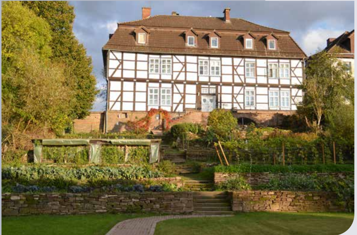
Das Forsthaus in Schorborn