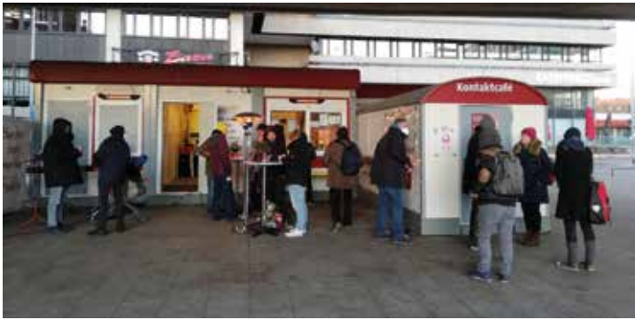
Begegnung am Bauwagen