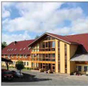
Therapeutische Gemeinschaft Amelith