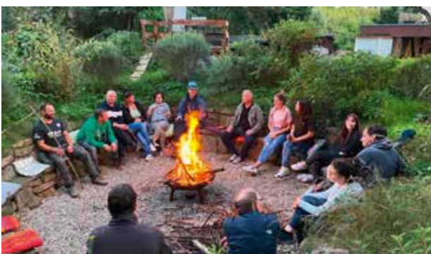
Gemeinschaft und Begegnung

2021 konnten an allen drei Standorten 49 Betroffene ( Amelith 24, Schorborn 15, Hannover 10 ) mit insg. 5504 Fachleistungsstunden ( Hannover 904, Amelith 2989, Schorborn 1611 ) in Gruppen- und Einzelkontakte betreut werden.