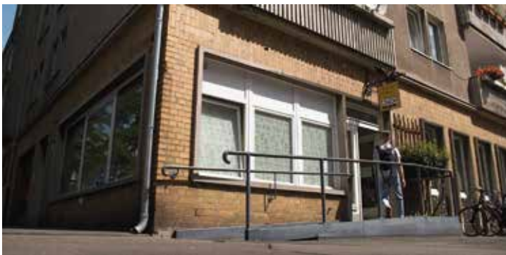
SOS-Bistro und mehr...

Das „SOS-Bistro und mehr...“ befindet sich in der Steintorfeldstr. 4A und liegt zentral zwischen der Drogenberatungsstelle in der Steintorfeldstr. 11 und dem Kontaktcafé Bauwagen.