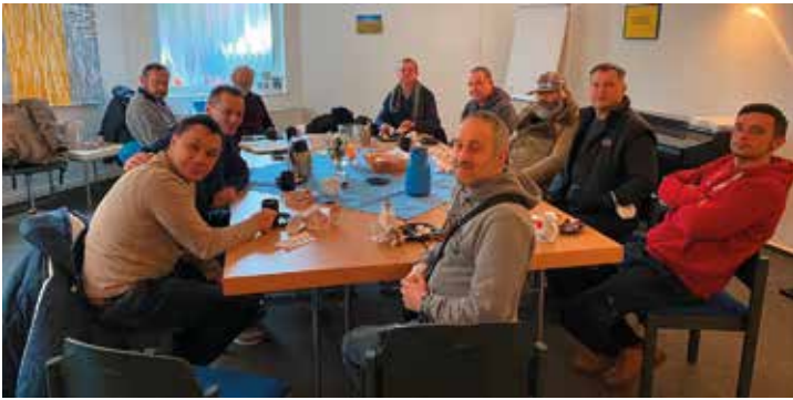
Das Themenfrühstück im SOS-Bistro