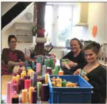
Die Kerzenwerkstatt in Amelith