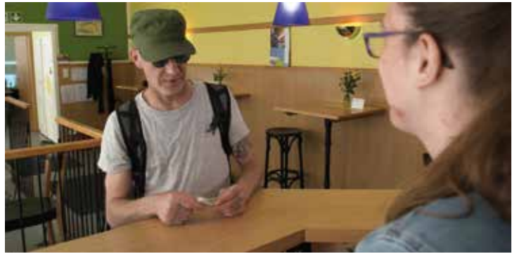
Ein Gast im SOS-Bistro