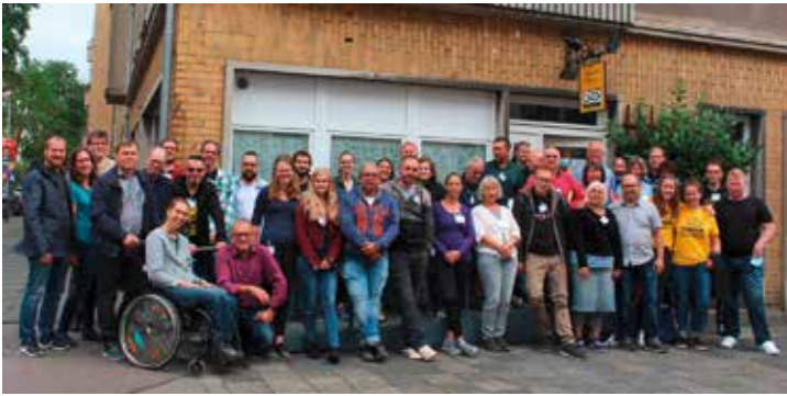
Ehrenamtlich Helfende für Summer in the City aus Therapie und Süddeutschland