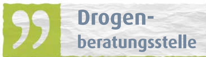
Mitarbeitende der Drogenberatungsstelle

Unsere Drogenberatungsstelle befindet sich als Teil der Fachstelle für Sucht und Suchtprävention seit 33 Jahren in zentraler Lage der Innenstadt hinter dem Hauptbahnhof in der Steintorfeldstraße 11. Im gleichen Haus befindet sich ebenfalls die Clearingstation. Nur wenige 100m fußläufig entfernt befinden sich die Tagestreffpunkte „Bauwagen“ und „Bistro SOS und mehr“.