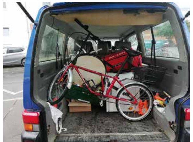
Auf dem Weg zum Schwarzen Bären - Detlef versorgt Betroffene mit Alltagsgegenständen

Durch die Pandemie hat die Streetwork eine größere Bedeutung bekommen. In vielen Einrichtungen können sich Betroffene tagsüber nur mit begrenzter Anzahl und Zeit aufhalten. Rückzug und Isolation sind häufig die Folge. Die Szenepätze wurden nur zum Teil stärker frequentiert. Aufgrund gezielter Observierungen und Polizeimaßnahmen wurden einige Betroffene in Haft genommen, so dass Szenepätze in der Innenstadt leerer waren. An der Methadonvergabe am Schwarzen Bären und am Übergang Passerelle – Andreas-Hermes-Platz hielten sich kontinuierlich viele Betroffene auf.