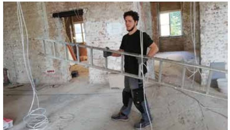
Ausbildungs- und Arbeitsplätze in Handwerksberufen finden

72 Personen (zum Teil substituiert, wohnungslos, drogenabhängig, psychisch krank) haben insg. 890 Arbeitsstunden erbracht.