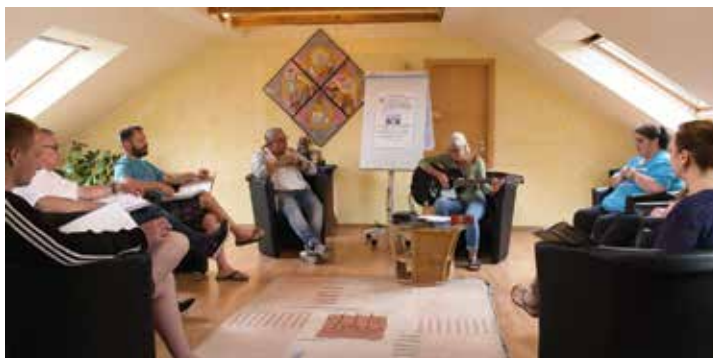
Der Andachtsraum in der Clearingstation Steintorfeldstraße 11

Die Clearingstation, Auffanghaus für drogenabhängige Männer und Frauen, befindet sich in der Steintorfeldstr. 11, 30161 Hannover.