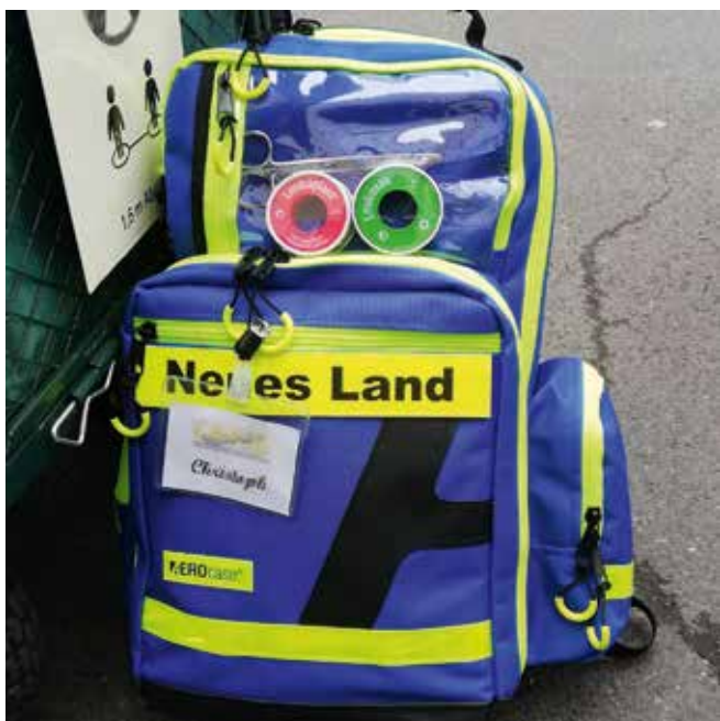
Medizinische Versorgung auf der Szene