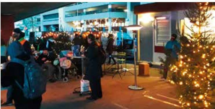
Heilig Abend am Bauwagen

Summer in the City: Vom 23.08.-27.08.2021 fand eine Einsatzwoche mit 52 hauptsächlich internen Mitarbeitenden auf der Drogenszene Hannovers und in größeren Städten der Umgebung statt. Besonders herausfordernd war der Szeneinsatz in Hamburg aufgrund der Menge an Betroffenen und dem hohen Grad der Verelendung. Durch diesen Einsatz konnte eine Frau in Therapie vermittelt werden. Eine neue Ausgabe der Zeitschrift „Der Ausweg“ (Ehemalige berichten von ihrem Weg aus der Sucht) wurde von vielen Betroffenen gut angenommen und intensiv gelesen. Zum Abschluss der Einsatzwoche gab es ein kleines Sommerfest vor dem Drogenkontaktkafé Bauwagen, zu dem im Verlauf des Nachmittags etwa 150 Betroffene kamen.