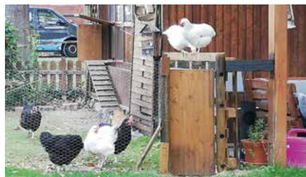
Hühner sind im Haus der Hoffnung eingezogen