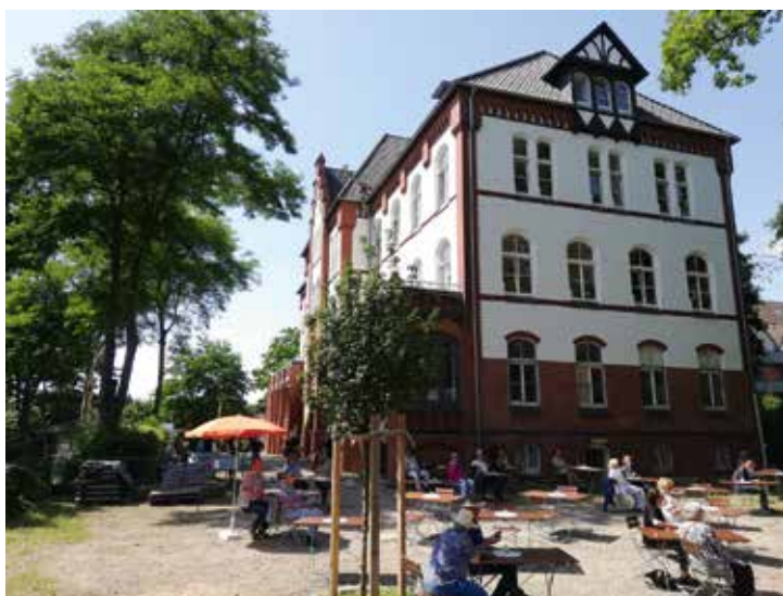
Das DENK.MAL.GARTEN Fest

2021 haben 5 ehemals drogenabhängige und 3 ehemals medienabhängige Personen das integrative Lebensmodell in Anspruch genommen.