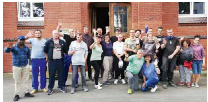
Arbeitseinsatz im Haus der Hoffnung

Seit einigen Jahren möchten immer mehr Betroffene im Anschluss an ihre Therapie noch weiterführende Unterstützung und Begleitung in Anspruch nehmen, um nicht in Sucht und Wohnungslosigkeit zurückzufallen.