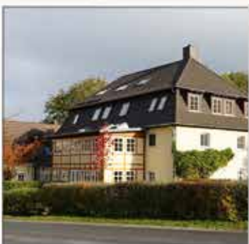
Therapeutische Gemeinschaft Schorborn